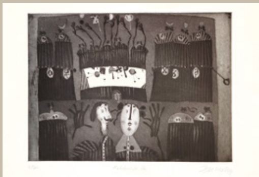
Relikvije, 1976, litografija, 56 x 38 cm