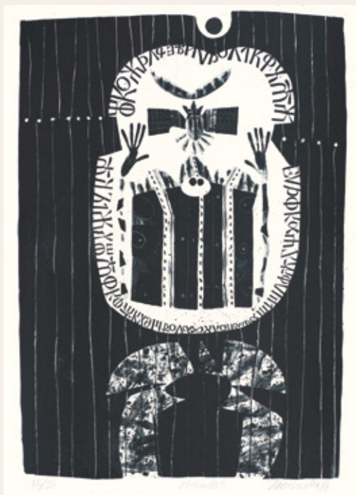
Zrcalo, 1977, litografija, 70 x 50 cm