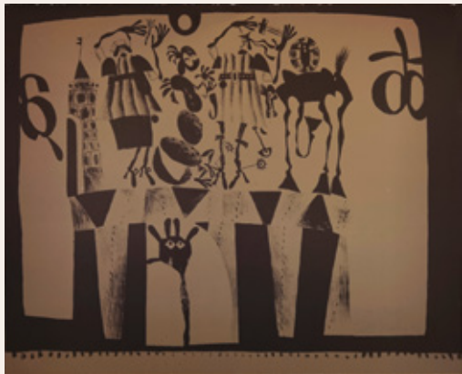
Pravljica, 1976, litografija, 57 x 70 cm