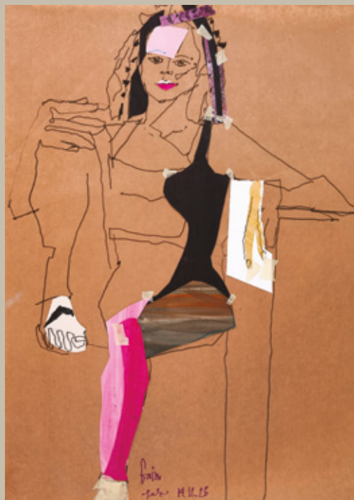
Gaia, 2023, kolaž, 70 x 50 cm