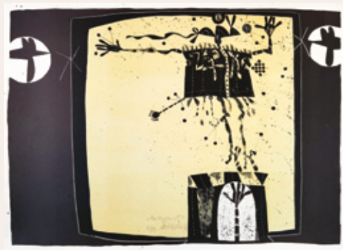
Humanist, 1977, litografija, 69,5 x 50 cm