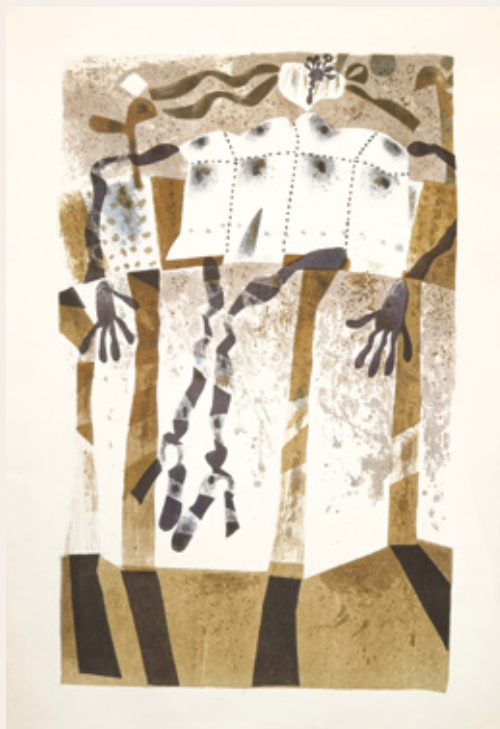
Mali princ, 1978, litografija, 50 x 34,5 cm