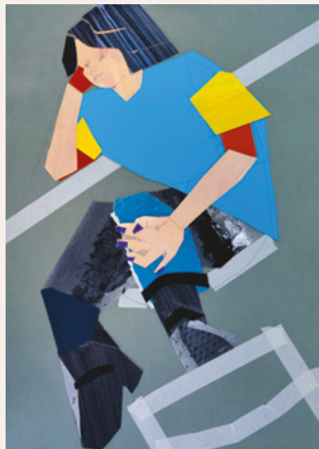
Mateja, 2024, kolaž, 70 x 50 cm