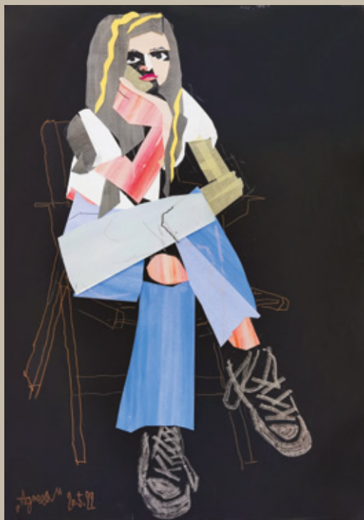
Agnesa, 2022, kolaž, 100 x 70 cm