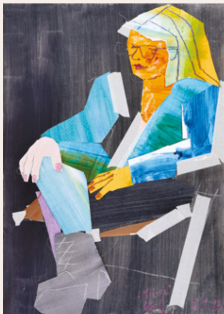
Milica, 2024, kolaž, 70 x 50 cm