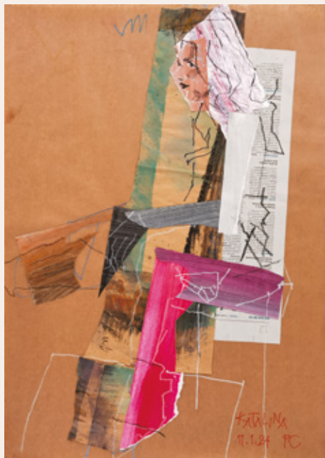
Katalina, 2024, kolaž, 70 x 50 cm