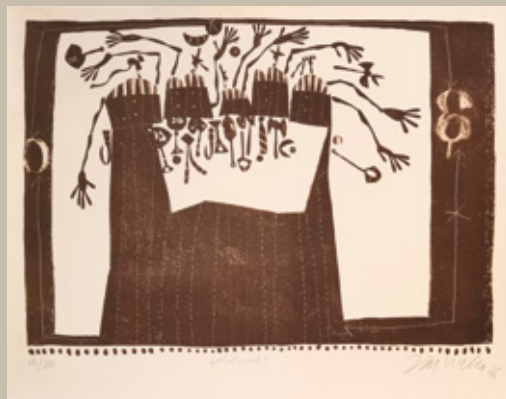
Ritual, 1976, litografija, 49,5 x 38,5 cm