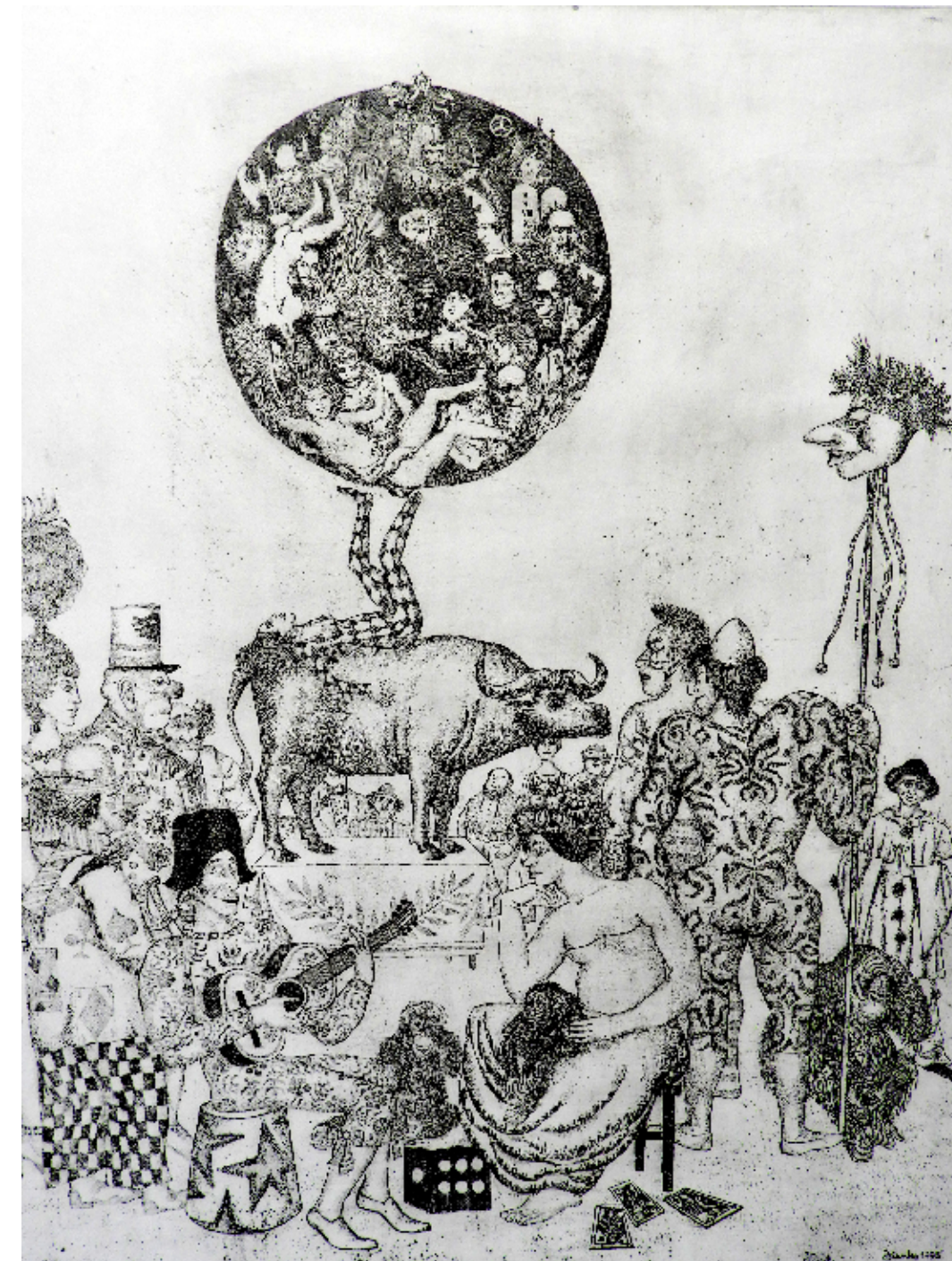
Karel Zelenko, Evropa, 1995, jedkanica, 70 x 50 cm