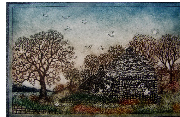
Stari golobnjak, 2013, 42 x 50 cm