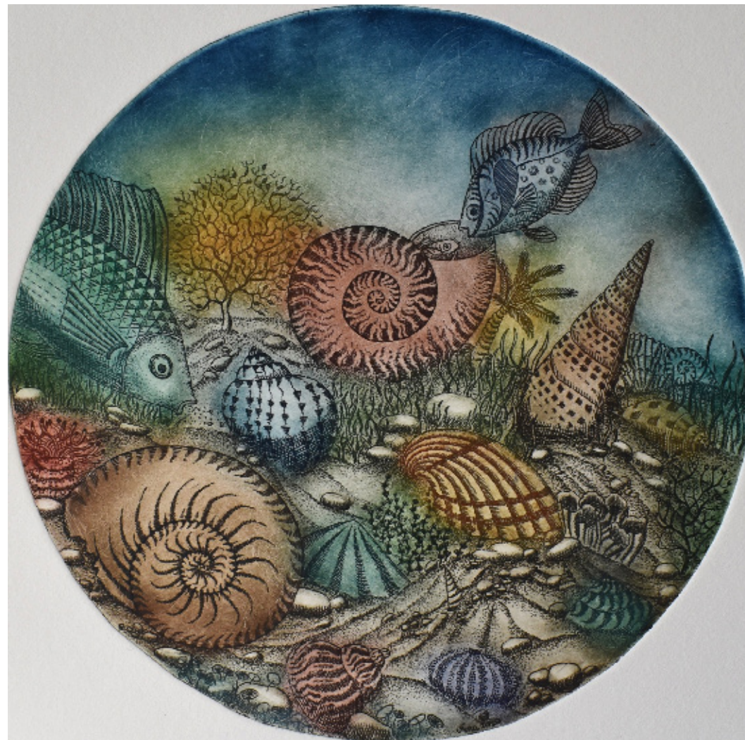
Nina Zelenko, Sožitje II, 2020, 33 x 33 cm