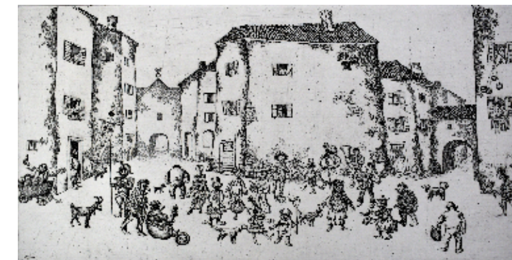
Pust v Grožnjanu, 2005, jedkanica, 50 x 65 cm