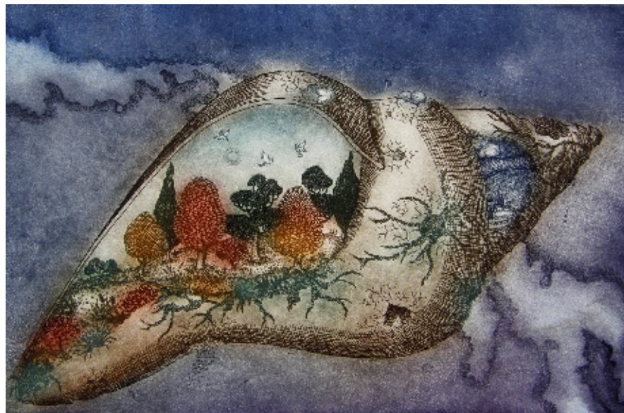
Nina Zelenko, Organizem, 2015, 42 x 50 cm