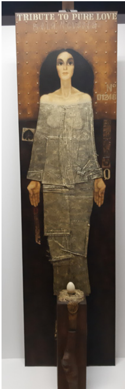
Tribute to pure Love, 2019 akril, kolaž/platno, les, 185 x 50 x 7 cm