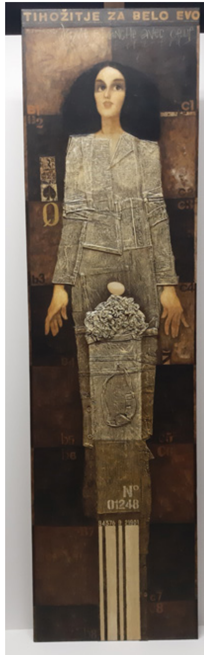
Tihožitje za belo Evo, 2019 akril, kolaž/platno, 185 x 50 x 7 cm