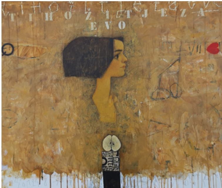
Tihozitje za Evo, 2015 akril, kolaž/platno, 67 x 80 cm