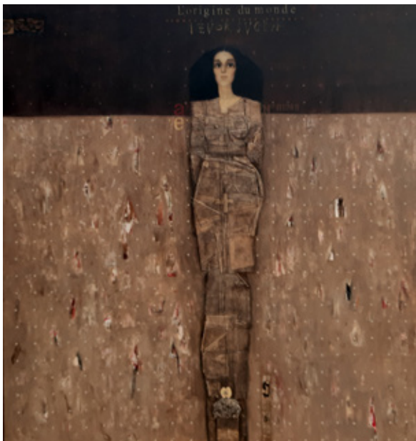
Izvor sveta / hommage à G. Courbet, 2021 akril, kolaž/platno, 195 x 195 cm